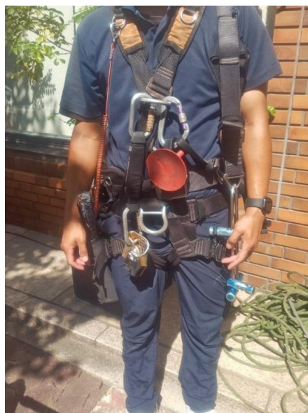
それぞれの用具の説明をおこなった。