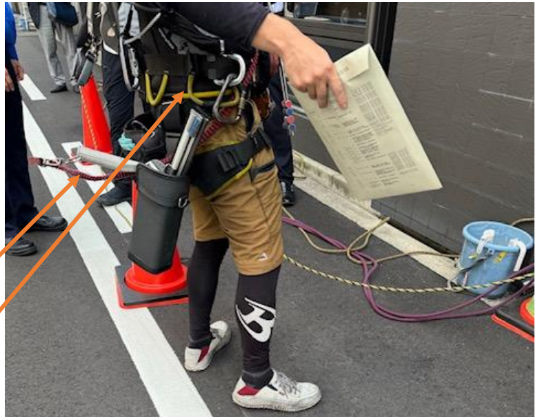
フルハーネス着用◎