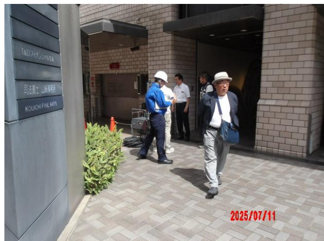
チェアー型ゴンドラ作業も準備中であつたが、ちょうど休憩に入り作業を確認できなかった。